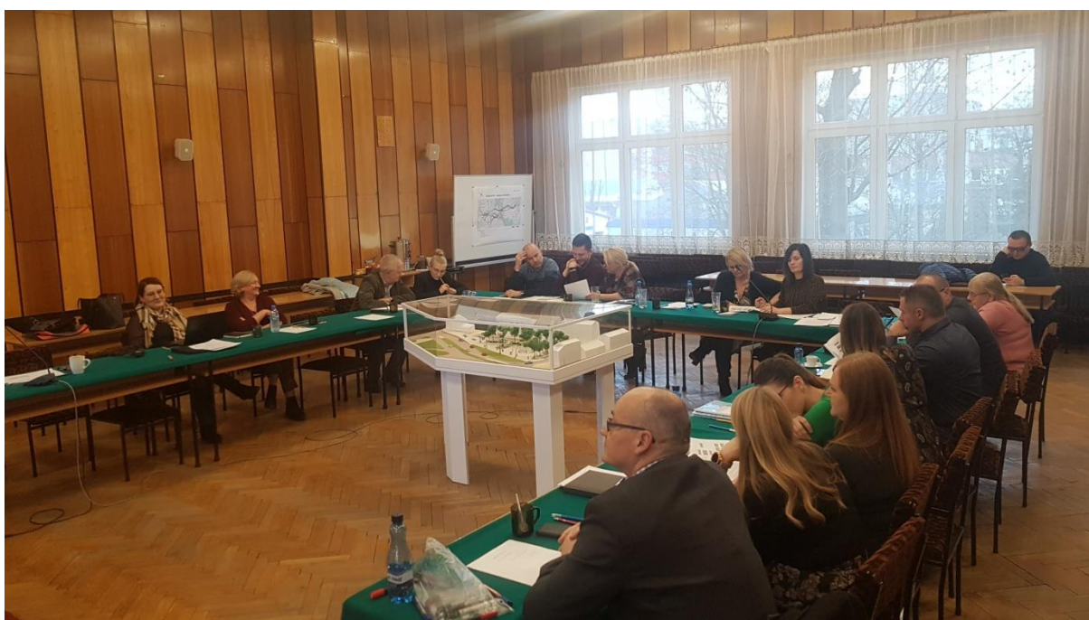
Zdjęcie z przeprowadzonych warsztatów